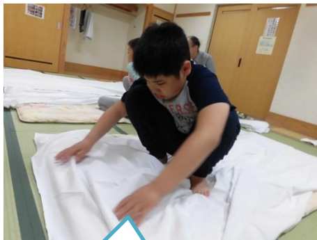
ベットメイキング